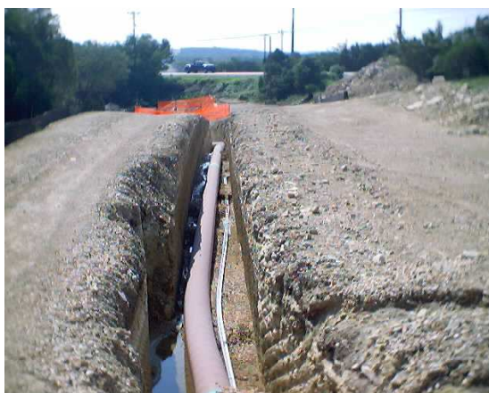
Cavo sensibile TraceTek TT5000 installato dentro un tubo PVC fessurato, lungo una condotta a parete singola sotterrata

Il cavo sensibile TraceTek TT5000 installato dentro un tubo PVC fessurato, lungo una condotta a parete singola interrata, può rilevare una piccola perdita di carburante localizzandola con grande accuratezza. Eventuali perdite, per capillarità, verranno in contatto con il cavo sensibile che determinerà il punto esatto in cui è stata rilevata la perdita.