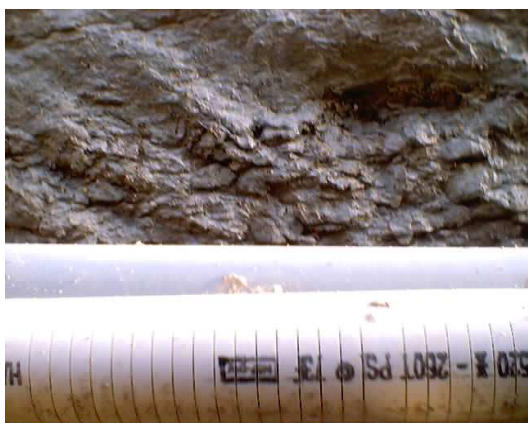
Tubo PVC fessurato Schedule 80