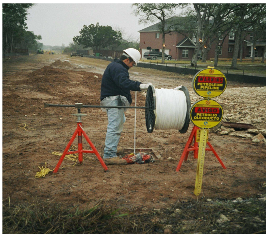
Il Sistema di Rilevamento Perdite TraceTek installato in 12 km di una "Area di Alto Rischio" lungo le condutture Longhorn in Austin, TX

I Sistemi di Rilevamento e Localizzazione Perdite TraceTek possono monitorare chilometri di condutture a parete singola interrata, per eventuali perdite di carburante, fornendo una localizzazione precisa del punto di perdita, chiudere le valvole prima che diventi una catastrofe ed interfacciarsi con un centro di monitoraggio e controllo per notificare l'incidente.